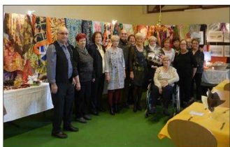
Ces dames passionnées de peinture sur soie étaient fières d'exposer le travail réalisé durant l'année.

Le club de peinture sur soie du CCI de Hochwald a tenu sa traditionnelle vente-exposition de foulards, abat-jour et tableaux ce dimanche à l'espace Wiselstein de Freyding-Merlebach.