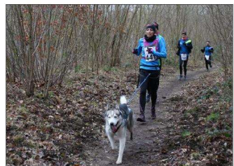
La majorité du parcours se trouve en forêt. Un environnement apprécié par les coureurs.